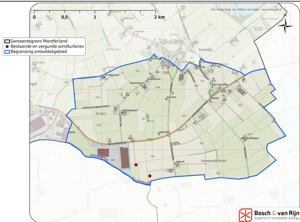
Figuur 1 Ontwikkelgebied voor windenergie: Lengel-zuidoost/Azewijn-zuid

Binnen het ontwikkelgebied komen gronden die bestemd zijn/worden voor bedrijventerreinen (DOCKSNLD1 en 2) niet in aanmerking voor het plaatsen van windturbines.